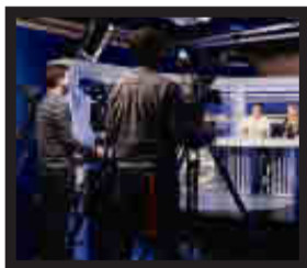
Facultad de Humanidades y CC. de la Comunicación