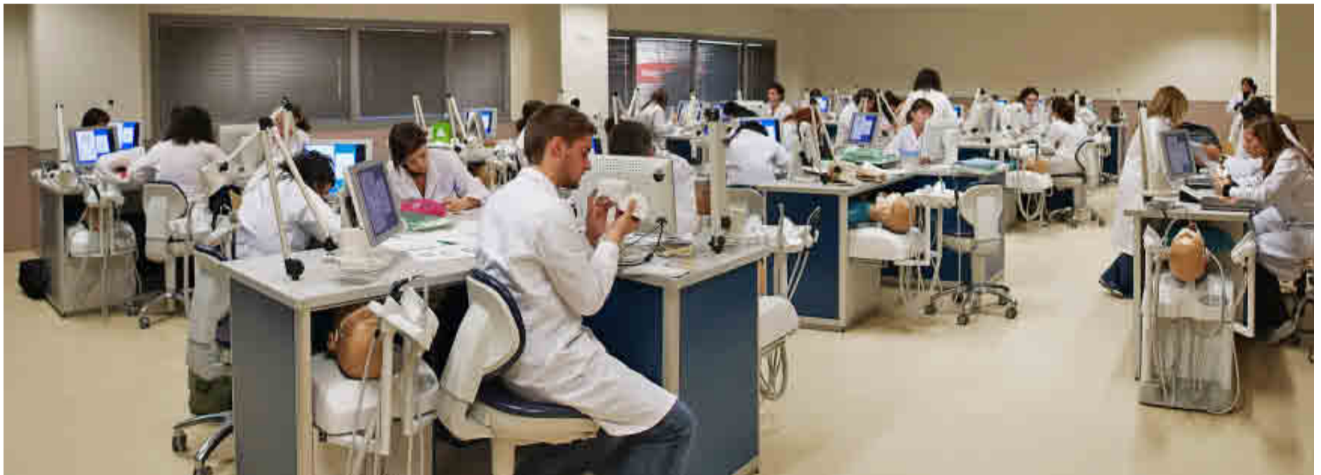
UNIVERSIDAD REY JUAN CARLOS