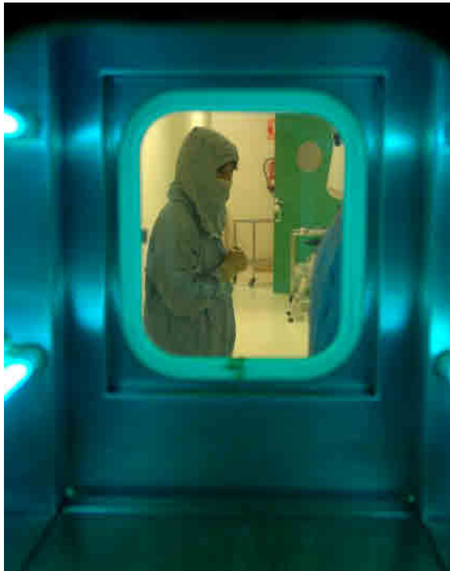
UNIVERSIDAD DE OVIEDO

La Universidad de Las Palmas de Gran Canaria ha sido distinguida con el Campus de Excelencia Internacional por su apuesta por un Campus Atlántico Tricontinental, que se basa en el desarrollo marino-marítimo como uno de sus ejes. De hecho, es referencia internacional en el estudio del mar.