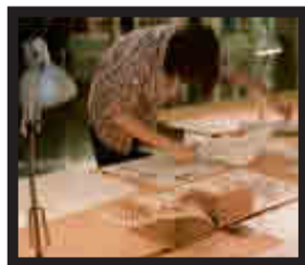
Escuela Politécnica Superior