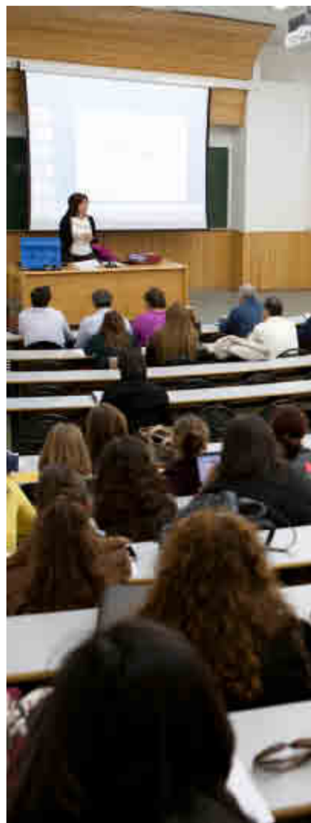
UNIVERSIDAD ALCALÁ DE HENARES

Los alumnos pueden completar hasta seis ECTS de prácticas profesionales en entidades colaboradoras como colegios y ayuntamientos.