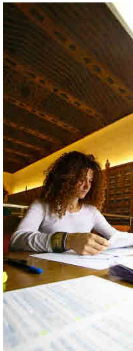
UNIVERSIDAD DE GRANADA

Tiene suscritos unos 80 convenios internacionales para el intercambio de estudiantes y profesores con centros de los cinco continentes.