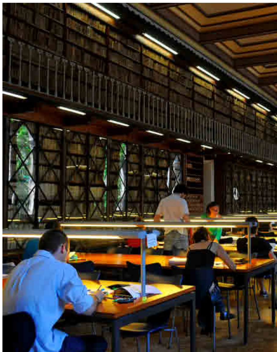
UNIVERSIDAD DE BARCELONA