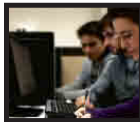
Facultad de Ciencias Económicas y Empresariales