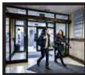
Facultad de Derecho