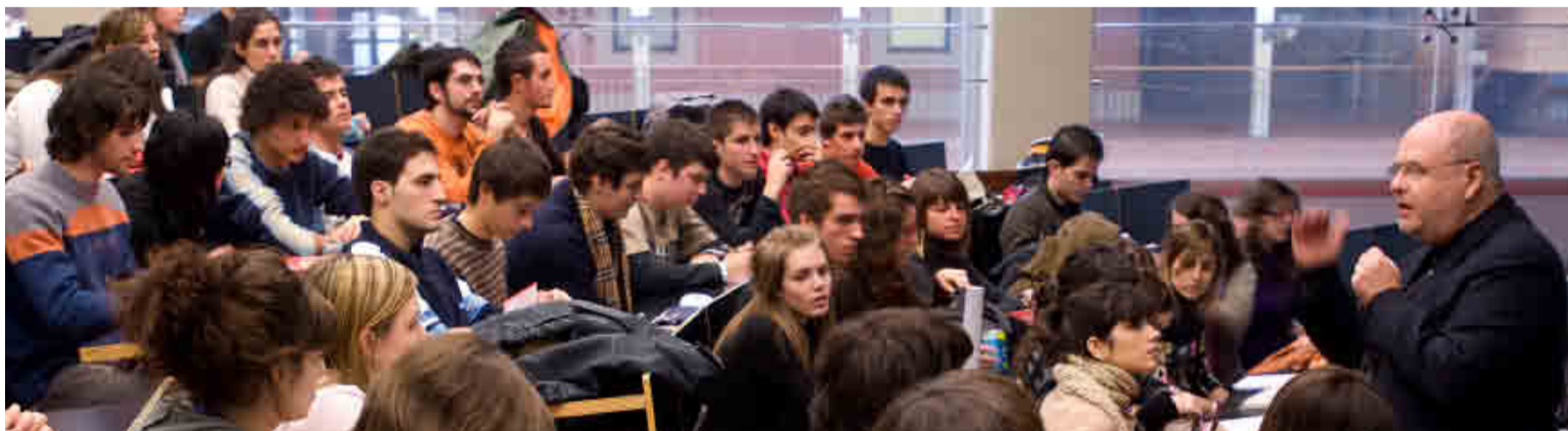
UNIVERSIDAD POMPEU FABRA