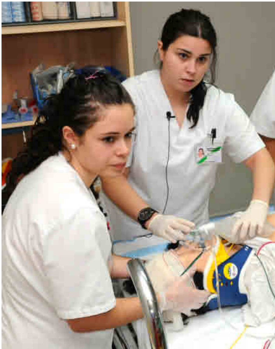
UNIVERSIDAD DE CANTABRIA