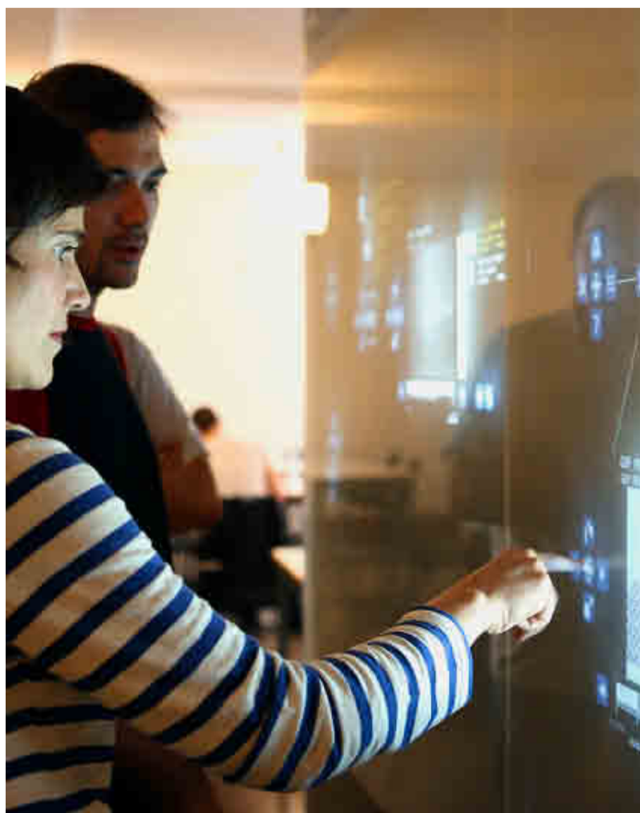
UNIVERSIDAD POLITÉCNICA DE MADRID

Los alumnos pueden elegir entre tres especialidades: Computación, Ingeniería de Computadores y Sistemas de Información.