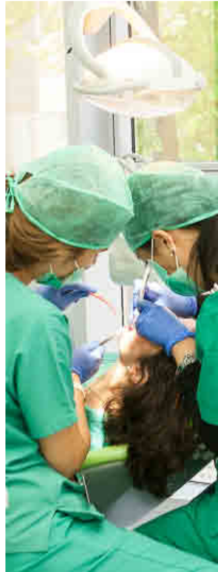
UNIVERSIDAD ALFONSO X EL SABIO

Para favorecer la inserción laboral de sus egresados, impulsa las prácticas externas, tanto curriculares como extracurriculares.