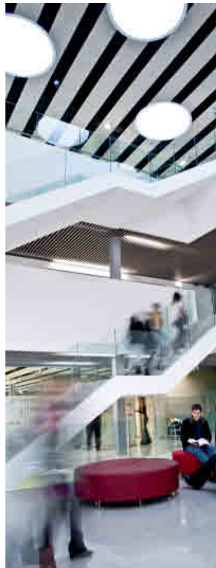
UNIVERSIDAD DE MONDRAGÓN