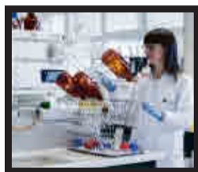
Facultad de Farmacia